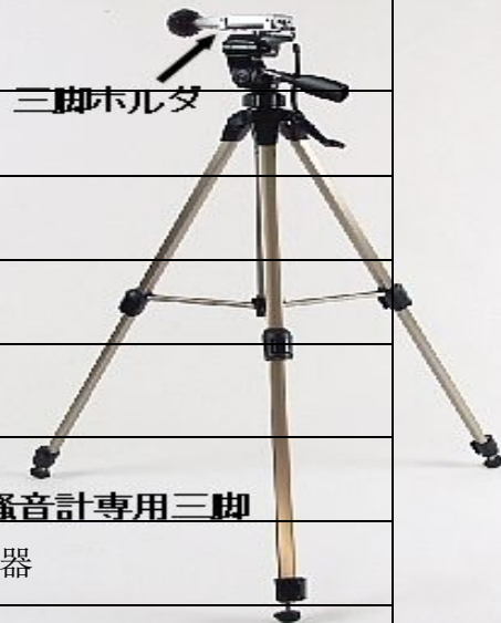
噪音计专用三脚架